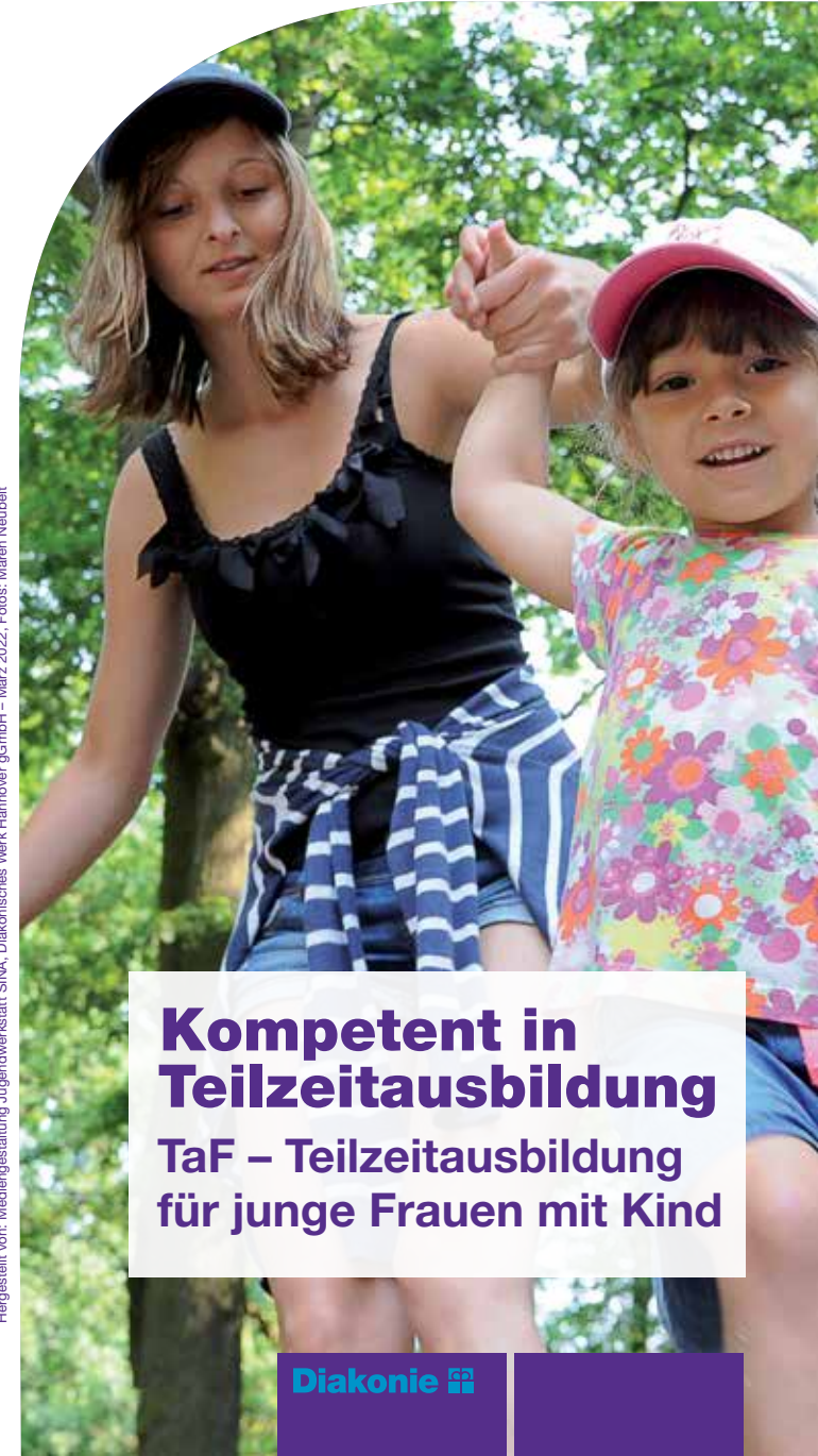
Hergestellt von: Mediengestaltung Jugendwerkstatt SINA, Diakonisches Werk Hannover gGmbH – März 2022

Kompetent in Teilzeitausbildung TaF – Teilzeitausbildung für junge Frauen mit Kind